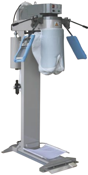
TO-210 ファッションパンツトッパー (1050×851×1704mm)