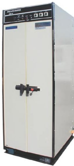
CBD-10/CBD-10ロータイプ/ CBD-10ステン/CBD-10ステンロータイプ スチームボックス タイマー式 (750×1000×2140mm 標準)

熱風吹き込み機構で優れた仕上げを実現します。静止乾燥機としての機能も充実、熱風は全排気式。断熱構造のフレームで熱を外に逃さず快適な作業環境を提供します。