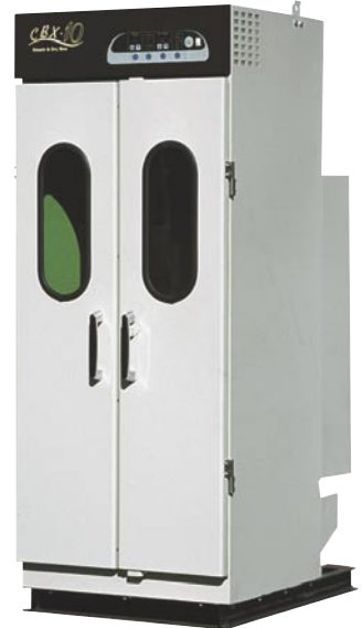
CBX-10 スチームボックス マイコン式 (750×1020×1885mm)

優れた仕上げを簡単な操作で実現します。設置場所高さを抑えたロータイプ、サビに強いステンスタイプを用意しました。独自のバイブレーション機能付き。