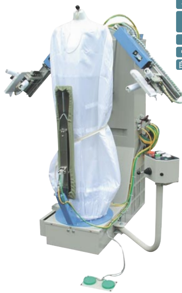
GF-250A マルチフォーム (1688×1125×1612mm 袖開)

理想的な人体形状で衣類を美しく成形できます。背広・ロングコート・ワンピース・スカートその他の上着の仕上げが初心者でも簡単にできます。