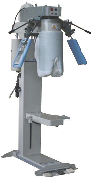
TO-500 ファッションパンツトッパー (1050×851×1704mm)

エア式自動エキスパンダーは作業性に優れ、58cmから110cmまでのウエストサイズに対応します。任意の位置にセットできるタック押さえ装置を搭載しています。