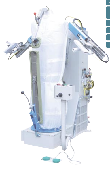
GF-350A マルチフォーム (1688×1125×1612mm 袖開)

背広・コートから水洗いのシャツ・白衣の仕上げまで対応します。任意のポジションで仕上げが可能な袖クランプ装置、ウエット仕上げ用乾燥スイッチなどを搭載します。