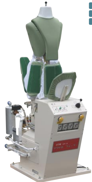
GF-3 サワヤカフォーマー (550×850×1570/最大2020mm)

シンプルな構造でトラブルが少なく、設備やランニングの費用を抑えられます。インバーター制御で風量を無段階で調節可能です。またエアバック、パットの交換も簡単です。