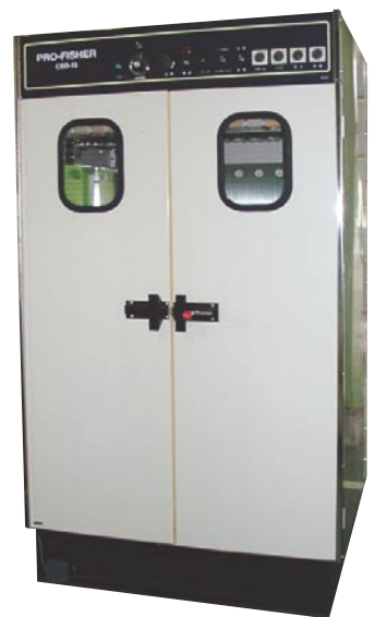
CBD-15/CBD-15ステン スチームボックス タイマー式 (1100×1000×1960mm)

独自のバイブレーション機能を追加し、優れた仕上がりを約束します。さまざまなオプション装置で利用範囲を広げることが可能です。