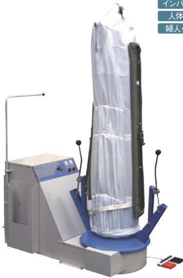
GF-201 人体プレス (500×1000×1610mm)