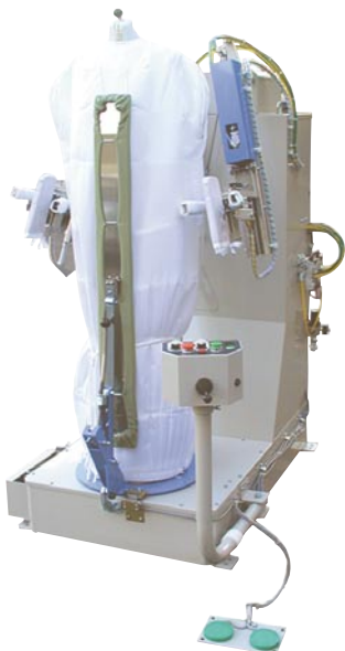
GF-550 マルチフォーム・インダストリー (1570×1410×1640mm 袖開)

イツミ独自の袖クランプ装置により作業の効率化と高品質化を実現します。スチーム噴射後肩部が自動で上昇するテンション機能、上下にスライドする衿押さえアーム付。