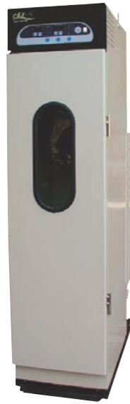
CBX-5 スチームボックス マイコン式 (460×900×1825mm)

TO-210の機能に加え、自動解放するタック押さえ装置、ペダル操作の自動裾押さえ装置を装備しています。裾押さえ装置の引っ張り強さはペダルで調節可能です。