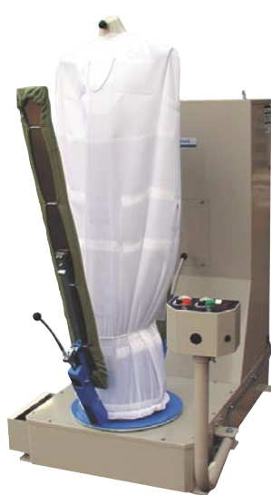
GF-500 マルチフォーム・インダストリー (750×1100×1640mm)

GF-250/350GFの長所を受け継ぎ、当社比5倍の蒸気ヒーターを搭載することで、素材を選ばず美しい仕上げを実現します。ストレート型、T型、袖差しなど各種オプションを豊富に用意。